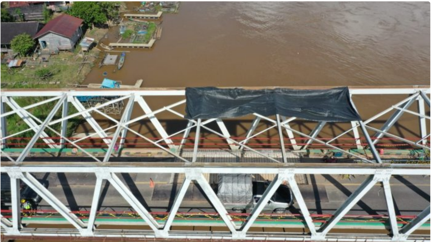
Jembatan Kasongan (Sei Katingan) Dalam Proses Perbaikan Oleh BPJN Kalimantan Tengah

KATINGAN - Penutupan jembatan Sei Katingan atau jembatan Kasongan, Kabupaten Katingan yang direncanakan akan ditutup pada tanggal 27 Maret 2023, akan diundur dua hari yaitu pada tanggal 29 Maret 2023.